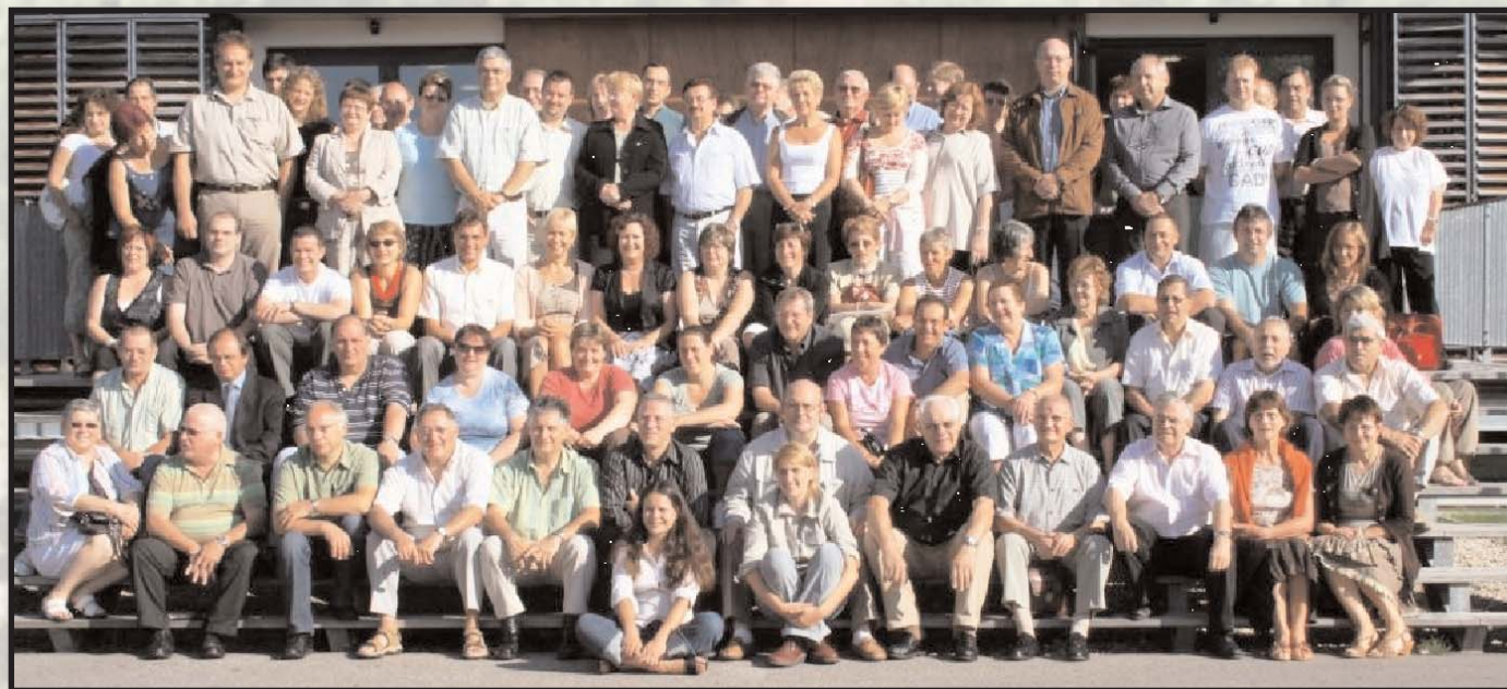
Participants du CAMA 2007